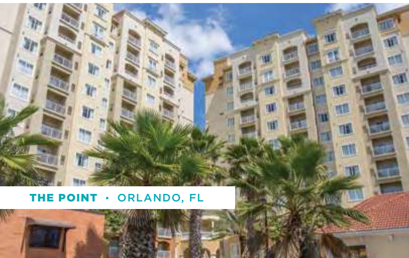
THE POINT · ORLANDO, FL