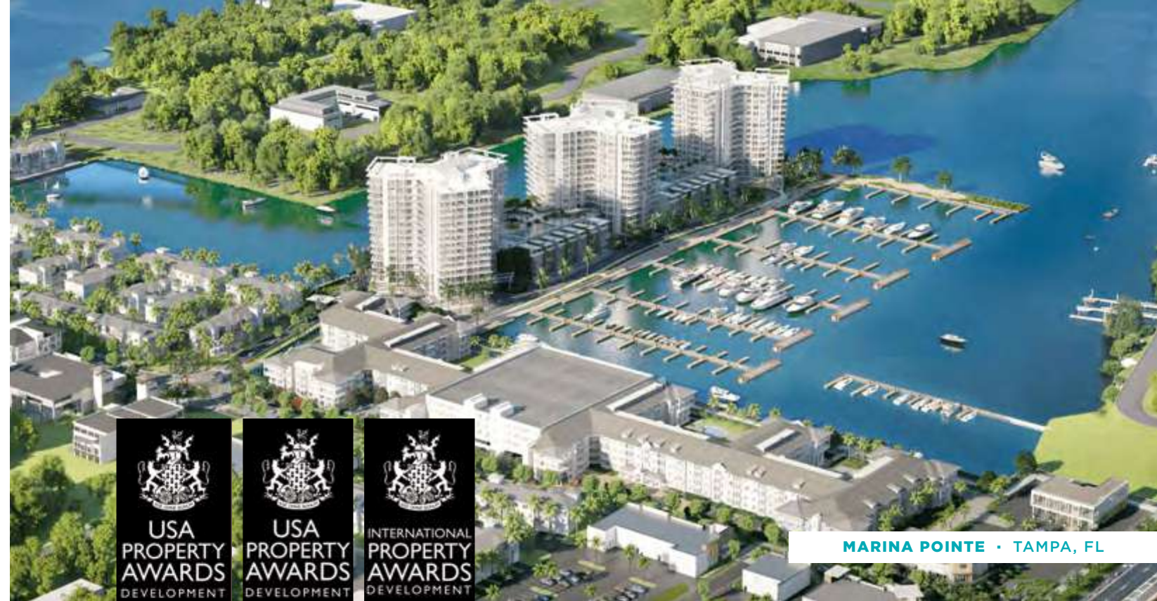
MARINA POINTE · TAMPA, FL