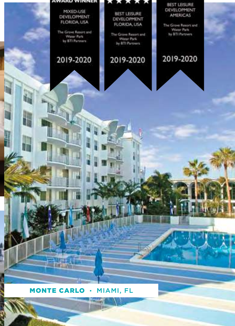
MONTE CARLO · MIAMI, FL