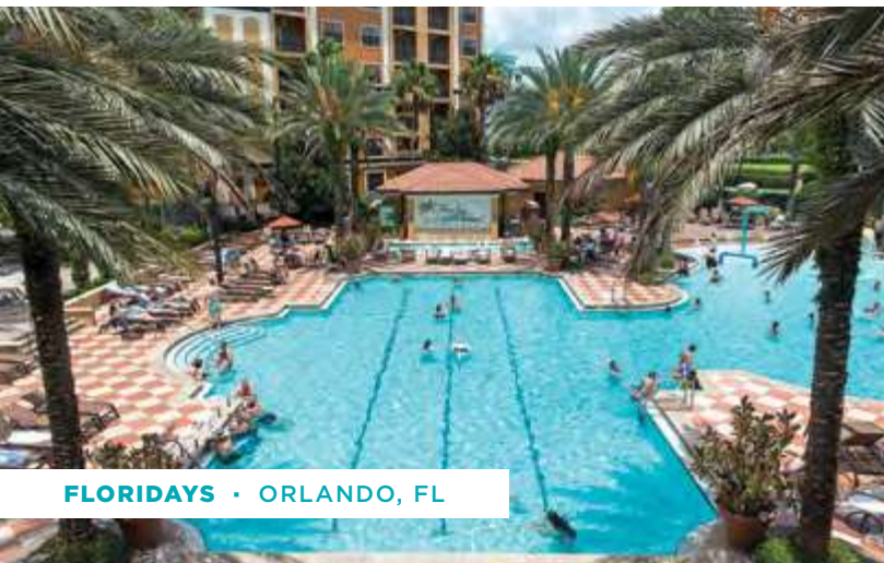
FLORIDAYS · ORLANDO, FL

galardonados, y cuenta con una reputación y un historial comprobado a nivel internacional en la obtención de resultados financieros sólidos para sus hoteles y propietarios todos los años. Su equipo de ejecutivos corporativos son veteranos de la industria hotelera y brindan apoyo y atención práctica todos los días a la cartera completa de hoteles y complejos turísticos.